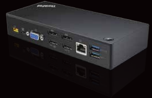
Estación de acoplamiento ▶ USB-C ThinkPad