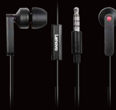
◀ Auriculares de botón Lenovo