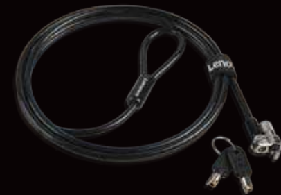
Candado de cable ▶ Kensington MicroSaver 2.0